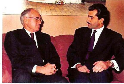
In Melbourne 20-21 December, 1997